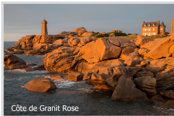
Côte de Granit Rose

Die Bretagne, der Traum eines jeden Fotografen. Und wir haben auch die Zeit und Muse, in diesem einwöchigen Workshop die Fotografie in den Vordergrund zu stellen.