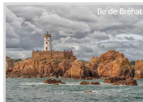
Ile de Bréhat

Die Preise und Leistungen entnehmen bitte dem Anmeldeformular auf unserer Internetseite und beinhaltet 7 Übernachtungen mit Frühstück. Die maximale Teilnehmerzahl beträgt