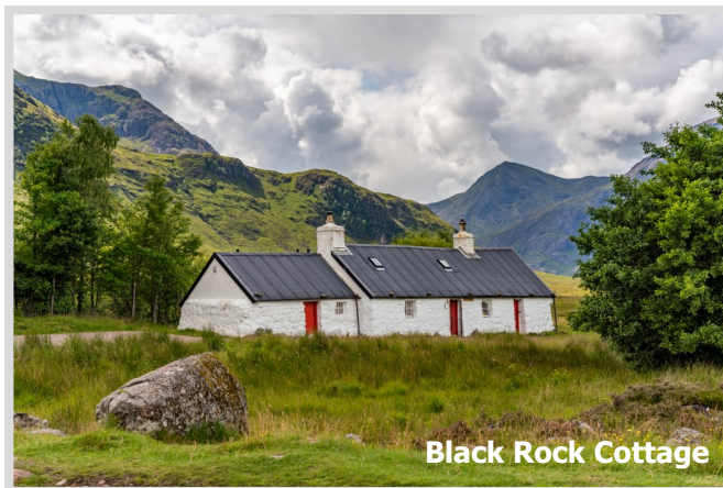
Black Rock Cottage

Wir kaufen gemeinsam ein und bereiten gemeinsam das Essen (die Kosten dafür werden geteilt). Wir sind somit an keine Essenszeiten gebunden und können variabel je nach Tageszeit und Wetterlage die besten Fotozeiten nutzen. Na klar gehen wir auch mal ins Pub was Trinken, Essen oder Musik hören! Wir sind mit maximal 7 Fotografen gemeinschaftlich in unserem firmeneigenen Minibus (Mercedes Vito) unterwegs.